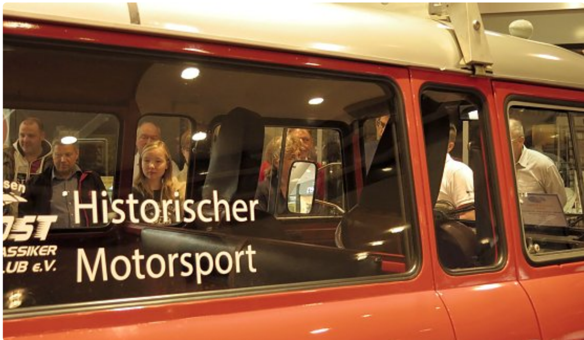
Ausstellung in der Südharz Galerie