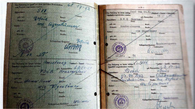
Der originale Kfz-Brief erzählt die Geschichte des 1952 in Eisenach gebauten BMW 340. Die Bilder unten entstanden beim Umbau zu einem EMW 340-2 durch Joachim Mäder und seine Mitstreiter.