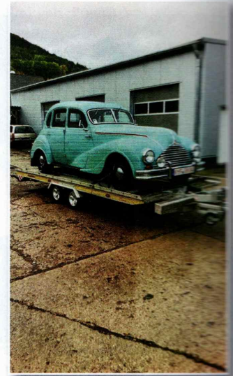
Der BMW 340 unmittelbar vor dem Umbau.